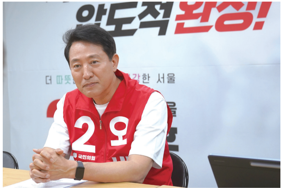
오세훈 후보는 AI 중심 실무 인재 양성과 '서울형 새싹원룸' 공급 등 청년 주거 사다리 복원을 통한 기반 마련을 약속했다.