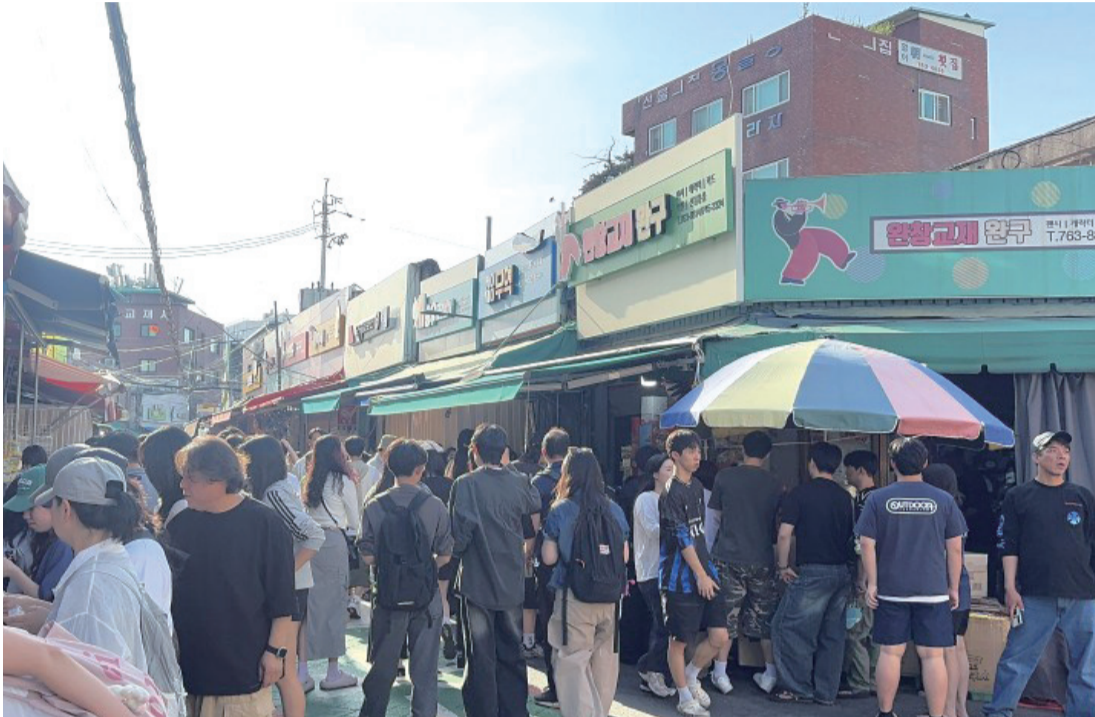
일상의 스트레스 해소와 자기표현을 위해 장난감을 찾는 대학생들의 키덜트 문화가 크게 번성하면서, 창신동 문구완구거리가 청년들로 북적인다.