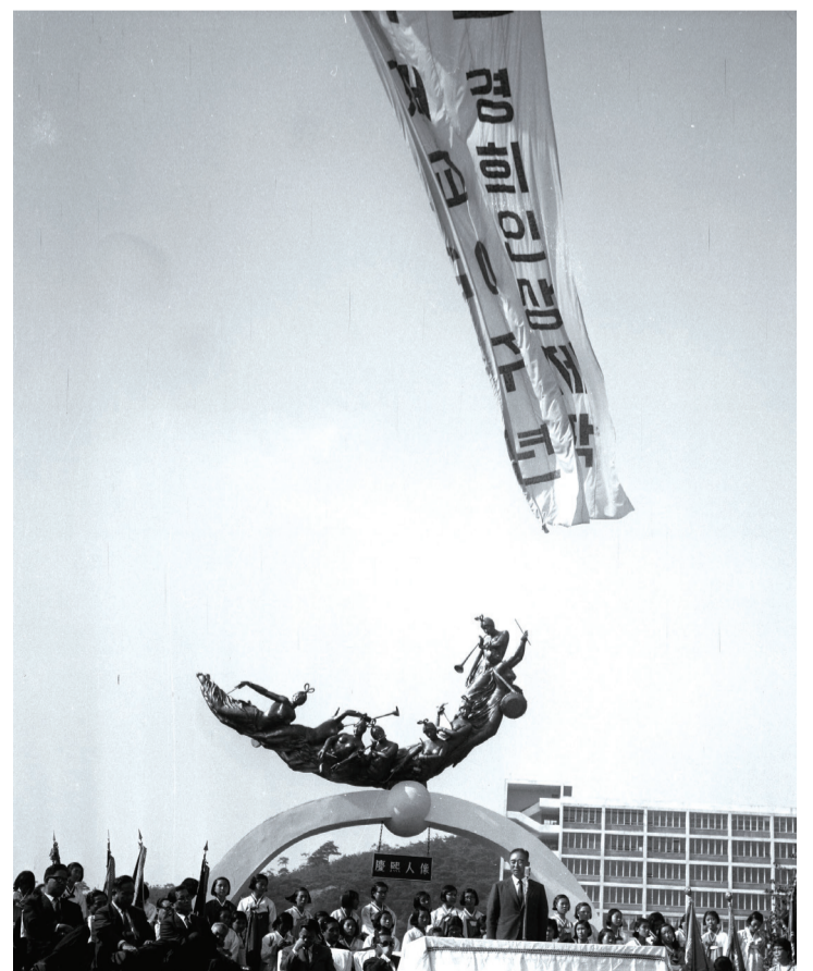
개교 20주년 경희인상 제막식이 열린 1969년 10월 30일, 수목이 우거진 현재 모습과는 사뭇 대조적이다.

선동호를 흐르던 분수 소리도, 드넓은 대운동장을 내려다보던 높은 본부석도 지금은 만날 수 없는 추억 속 존재가 되었지만, 경희인상에 새겨져 있던 그 문구는 ‘의지는 역경을 뚫고 협동은 기적을 낳는다’는 문구로 이어져 지금도 여전히 학생회관 입구 머릿돌에 남아 있다.