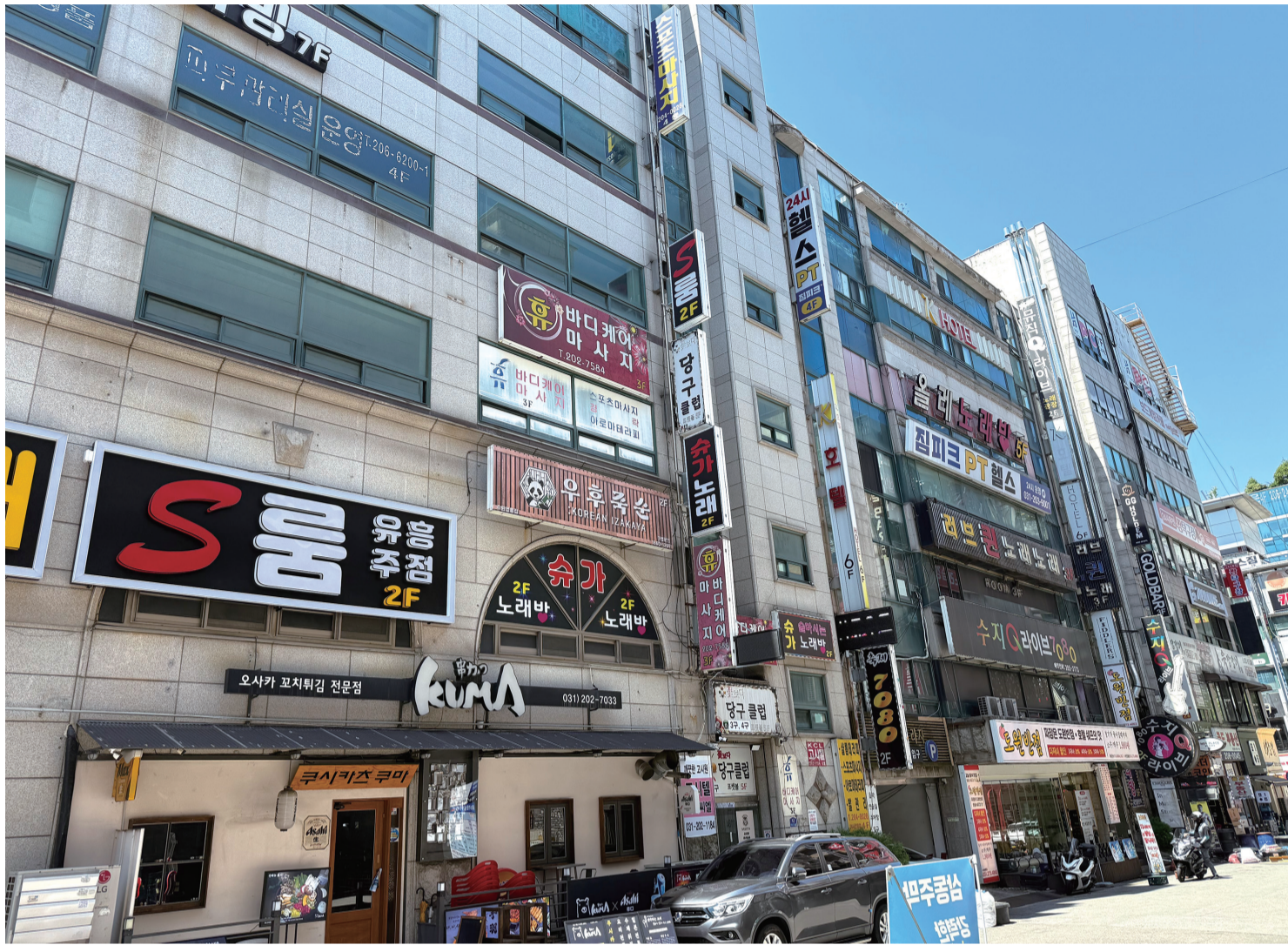
아르바이트(알바) 고용난 속 일부 학생들은 고수의 알바로 눈을 돌리고 있는 상황이다.