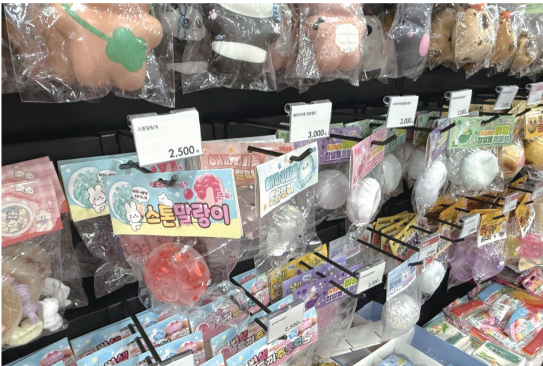
최근 인기를 끌고 있는 말랑이나 악뿌불 같은 촉감형 완구는 '스트레스 해소 수단'으로 소비되기도 한다.