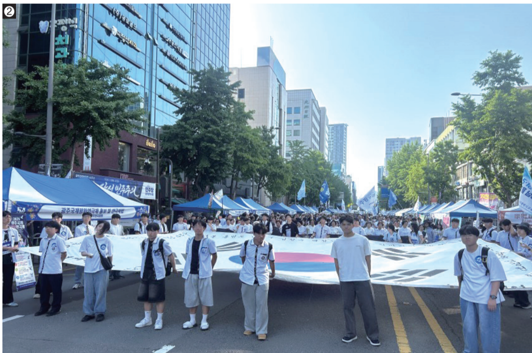
① '자주경희' 깃발을 흔들며 가는 경희총민주동문화 ② 태극기를 나눠 들고 행진한 광주 고등학생들