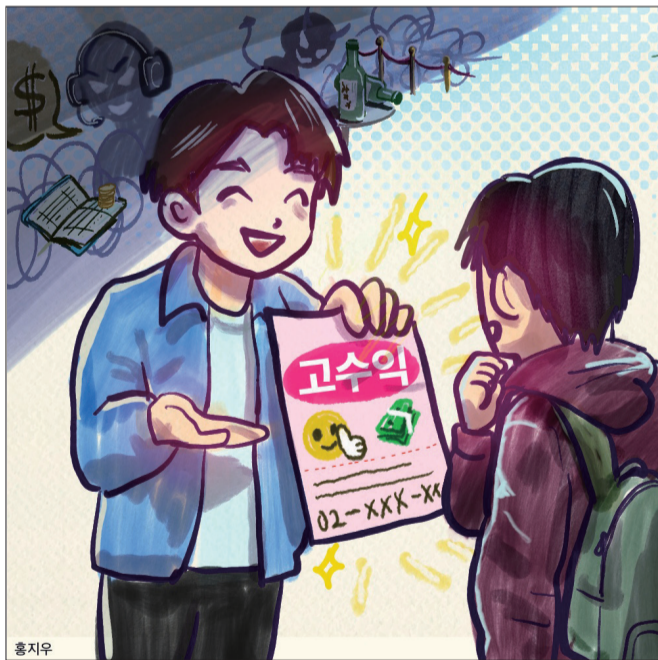
만평 고수의 알바의 이면

쉽게 벌 수 있는 돈은 없다. 높은 시급과 빠른 수익을 앞세운 알바일수록 그 이면을 따져봐야 한다. 고수의 알바를 경계하고 유혹의 손길을 뿌리치는 일은 학생들이 스스로를 지키는 첫걸음일 것이다.