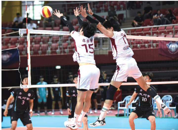
배구부가 15일 '2026 KUSF U-리그' 경일대 원정경기에서 세트 스코어 3-0으로 승리하며 2연승으로 기세를 이어가고 있다.

배구부는 지난달 16일 호남대와의 홈경기에서도 세트 스코어 3-0(25-11, 25-22, 25-14)으로 승리하며 상대를 압도했다. 이같은 연승은 지난달 3일 홍익대 원정경기에서 세트 스코어 0-3(20-25, 17-25, 25-27)으로 패배한 이후 달