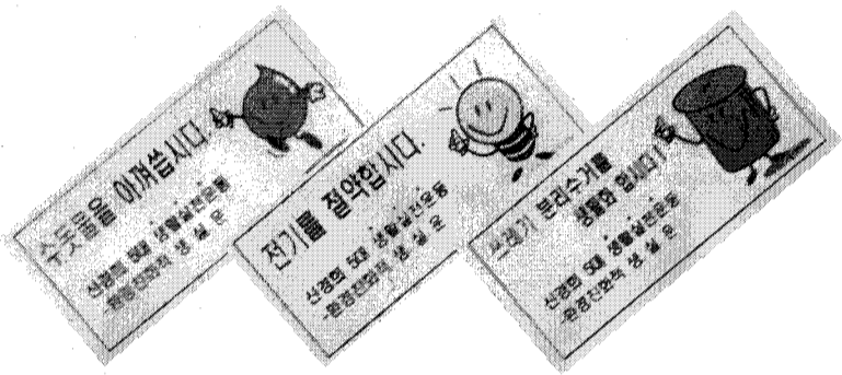
▲신경희 5대실천운동의 일환으로 수원총학생회가 제작한 포스터