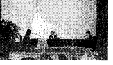
조정래씨 초청, 독서토론