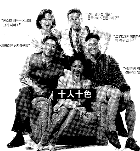
"판스리 배우는 X세대, 그게 나야!"