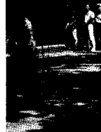
◀ 지난 5일 11시50분 수석관입구에서 결단식

교수·학생간의 불신을 씻고 경회복을 위해 서로 노력하는 마음을 갖자는 계기로 마련된 이번 등반대회는 보외교수 이상으로 단체학원, 교외과장, 학과장 등 40여명이 총합계 100여명 규모의 등반대회를 가졌다.