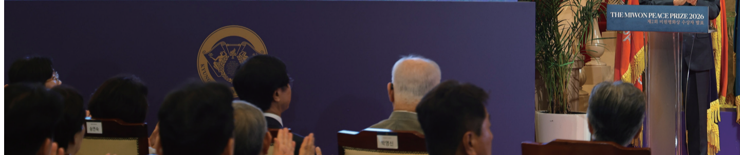
'제2회 미원평화상' 세계원자과학자 협회 수상

지난달 29일 우리학교 평화의전당에서 '제2회 미원평화상' 수상자 발표식이 열렸다. 수상자로는 'The Bulletin of Atomic Scientists(세계원자과학자협회)'가 선정됐다. 시상식은 오는 9월 21일 세계평화의 날 기념행사와 동시에 평화의전당에서 진행된다.