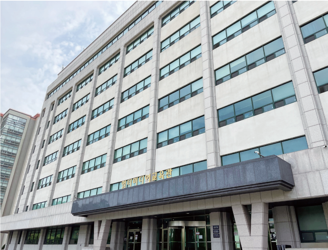
국제캠퍼스 후마니타스칼리지 대학생위원회가 출범했다.

부터 우리학교 전임교원 담당 강의 비율은 점차 감소해 왔다. ▲2019년 1학기 61.2% ▲2019년 2학기 61.7% ▲2020년 1학기 60.5% ▲2020년 2학기 59.5% ▲2021년 1학기 59.8% ▲2021년 2학기 58% ▲2022년 1학기 56.9%로 전임교원의 강의 비율은 6학기 동안 지속적인 감소 추이를 보였다. 그러나 2022년 2학기 59.2%를 시작으로 반등해 이번 학기 59.6%까지 증가한 것이다. 이와 관련 기획조정처 학술진흥팀은 “전임교원 수가 증가하면 전임교원이 강의를 담당하는 비율도 자연스럽게 증가한다”고 설명했다. 실제 학술진흥팀이 제공한 자료에 따르면 우리학교 전임교원 수는 ▲2022년 1학기 1,361명 ▲2022년 2학기 1,391명 ▲2023년 1학기 1,396명으로 점차 증가했다. 다만 학술진흥팀은 “전임교원의 담당 강좌, 연구년 및 휴직 현황 등에 따라 변동이 발생할 수 있다”며 “전임교원 수와 전임교원의 강의 담당 비율이 정비례하게 증가하는 것이 아니다”라고 덧붙였다. 우리학교의 전임교원 강의 담당 비율은 서울의 주요 대학 11개 중 4위를 기록했다. 대학알리미에 공시된 서울 주요 11개 대학의 2023년 1학기 전임교원 강의 담당 비율은 ▲중앙대 67.1% ▲한양대 65.6% ▲서강대 60.6% ▲성균관대 58.7% ▲서울시립대 54.9% ▲고려대 53% ▲이화여대 51.8% ▲연세대 51.2% ▲서울대 50.4% ▲한국외대 48.2%이다.