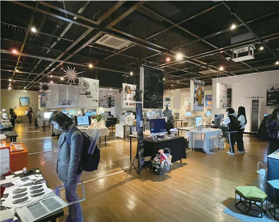
예술디자인대학 2층 A&D 홀에서 제31회 산업디자인학과 졸업전시회가 개최됐다.

한편, 2024학년도 신입생 모집계획도 발표됐다. 수시 모집인원은 20명 축소돼 총 2,890명, 정시 모집인원은 9명 확대돼 총 2,418명이다. 수시 모집의 경우 학생부종합전형에서 자기소개서가 폐지되는 등의 변동이 있다. 특히 논술우수자전형은 논술고사를 100% 비중으로 반영해 신입생을 선발할 방침이다. 정시 모집의 주요 변경사항은 인문·자연계열로 분할모집하는 학과의 인문계열 수능 반영영역이 지정된다는 점이다. 이에 ▲지리학과 ▲한의예과 ▲간호학과 ▲건축학과의 인문계열 모집단위는 수능 수학 반영과목으로 확률과 통계, 탐구 반영과목으로 사회탐구 2과목을 응시해야 한다.