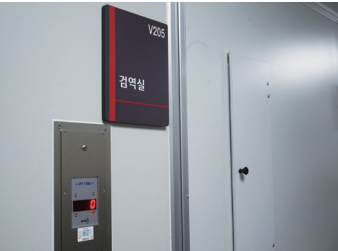
중앙실험동물센터 내 감염실

능성을 최소화해 특수 제작됐다. 개소식에 참석한 한균태 총장은 “과거에 비해 체계화된 센터가 구축돼 기쁘다”며 “환경친화적이고 윤리적인 중앙실험동물센터를 활용한 다양한 시너지 효과를 기대한다”고 말했다. 또 한 총장은 “세계적 수준의 연구가 나올 수 있도록 지속적인 지원을 하겠다”는 약속도 전했다.