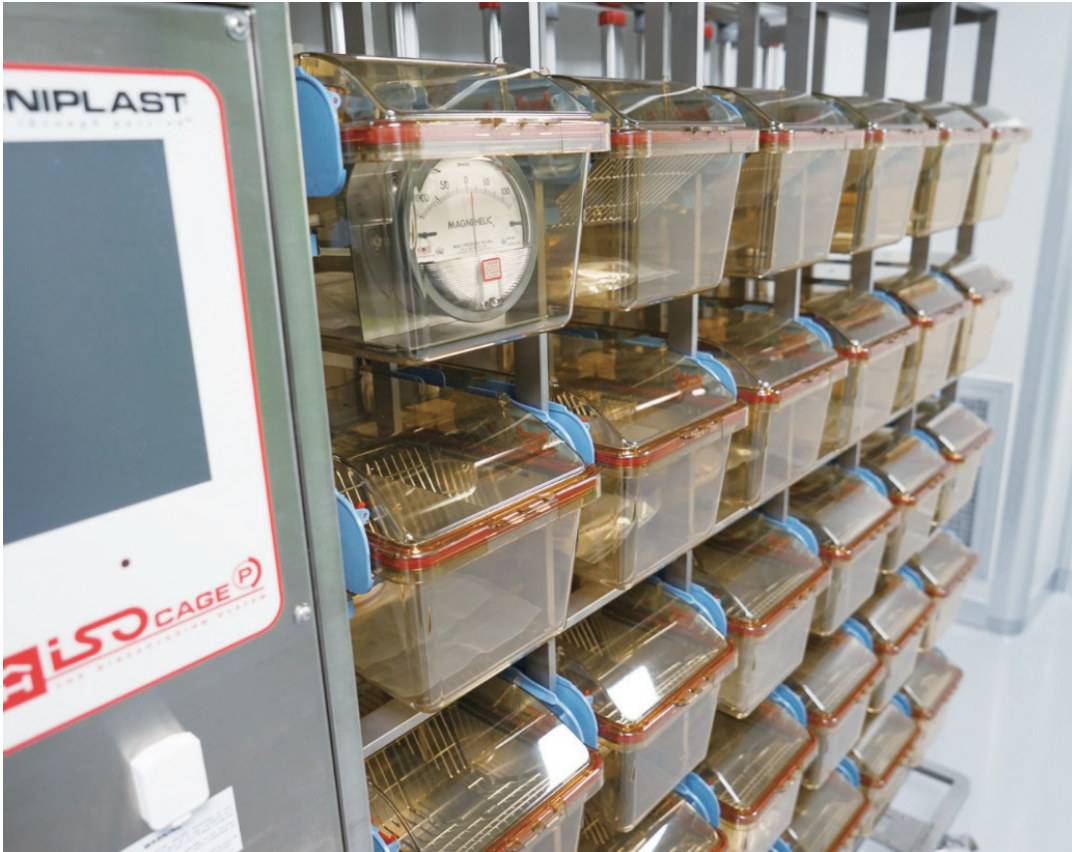
중앙실험동물센터 감염 랫드 사육실

해 학기 중에 근무 시간이 조정되는 문제가 발생했다”고 설명했다. 장학팀에 따르면, 2022년 근로 장학금 배정액은 약 10억 6,400만 원으로 2021년 기준 약 16억 원보다 약 6억 삭감됐다. 2022년 최저시급 기준이 9,160원으로 오르면서 학기 중 근로 시간이 지난해 대비 부서별로 40%씩 줄어든 상황이다. 국가 근로 장학금은 한국장학재단에서 대학별로 3월에 신청을 받는다. 이후 한국장학재단에서 4월 각 대학에 예산을 배정한다. 예산 배정 이전에는 장학팀 또한 정확한 예산을 파악할 수 없다. 장학팀은 한국장학재단으로부터 예산이 삭감된다는 공지를 전달받은 후 이를 각 근로 장학 운영 부서에 전달했다. 그러나 1학기 국가 근로 장학생 모집은 대개 3월 이전부터 이뤄진다. 이에 일부 부서에서는 갑작스럽게 근로 시간을 조정해야 했다. 장학팀은 “매년 예산이 삭감될 수 있다는 공지를 각 부서에 보낸다”며 “장학팀은 각 부서에 총 근로 시간만 배정할 뿐 근로 인원 및 개인 근로 시간은 각 부서의 관할”이라고 전했다. 국제캠 근로 장학 운영 부서 가운데 하나인 중앙도서관은 “대면 전환 이후에 대한 고민이 크다”며 “기존에 비해 시간당 1~2명 줄어든 상황인데, 대면 전환으로 2학기에 도서관 이용자가 늘어난다면 이를 어떻게 감당해야 할지 의문”이라며 국가 근로 장학 배정액 삭감에 따른 어려움을 토로했다.