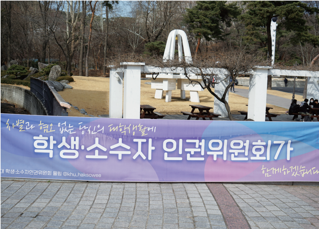
제1대 학생·소수자인권위원회(학소위) ‘울림’이 출범했다.

학소위는 서울캠 총여의 공백을 채울 학생자치기구이지만 과거 총여의 활동 범위와는 차별되는 지점을 뒀다. 전 위원장은 총여가 활동했던 시기를 포함해 총여가 해산된 직후까지 우리학교 전체 학생을 대표하는 인권위원회가 부재함을 지적했다. 이어 “총여와 학소위의 가장 큰 차이는 다루는 의제의 범위”라고 말하며 “불평등에 대항한다는 가치관은 총여와 동일하지만 학소위는 성별이라는 정체성에서 나아가 성적 지향, 종교, 출신 지역, 피부색, 사회경제적 지위 등 다양한 차별에 대항할 것”이라고