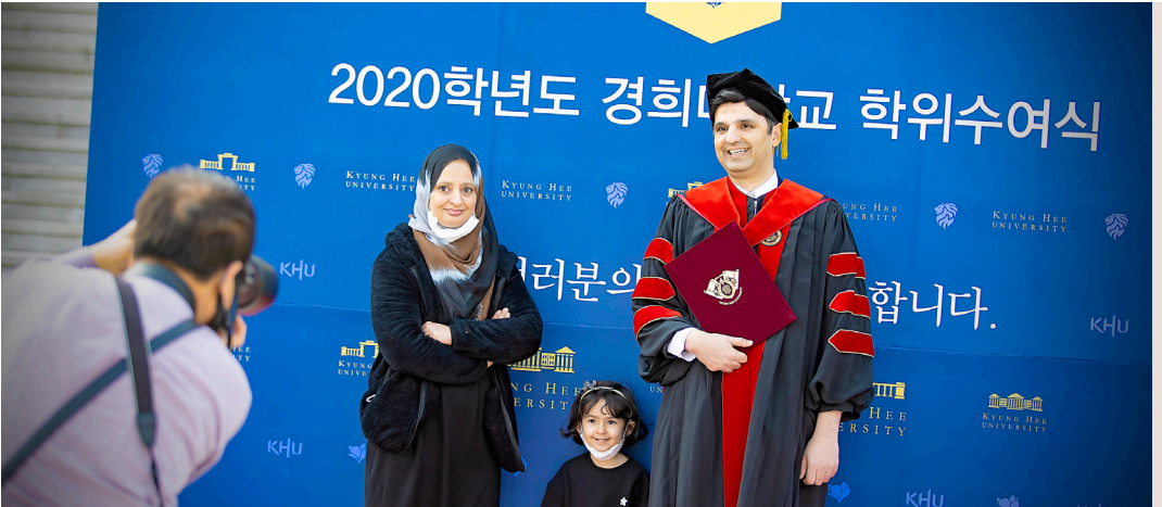
우리학교 학부 과정에 등록한 외국인 유학생 수는 5년 연속 증가세를 보이고 있다.